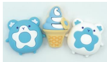
ぷっくりマグネット

ネモフィラとあわせておすすめしたいのが、春のネモフィラグッズ。ネモフィラをモチーフにしたマスコットキャラクター「ルリィ」と「アイシィ」のグッズが、昨年に続いて次々と登場しています。愛らしいフォルムの「ぬいぐるみ」や、ぷっくりとした姿が可愛い「ぷっくりマグネット」、お気に入りの本の目印にしたい「クリップブックマーカー」、など、かわいいグッズが目白押しです。