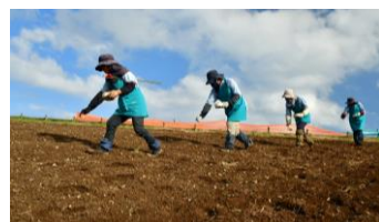
ネモフィラの種まきの様子