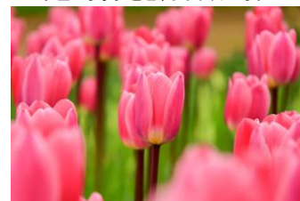
「ライト&ドリーミー」