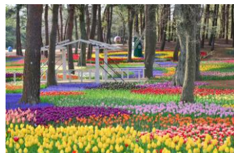
昨年の見頃の様子（2024年4月16日撮影）

淡いピンクと白が混ざり合うグラデーションが特徴の「ライト&ドリーミー」は、深い紫色の茎と花びらとのコントラストが美しい品種です。その名の通り、明るく幻想的な雰囲気が花畑をふんわりと明るく彩ります。また、様々なチューリップが咲く中で、凛としたかっこよさが魅力の品種「スラヴァ」や、鮮やかな朱赤色の花が特徴の原種系チューリップ「ブラエスタンス将軍」などユニークな品種も咲いているので、お気に入りの品種を探しながらの散策もおすすめです。