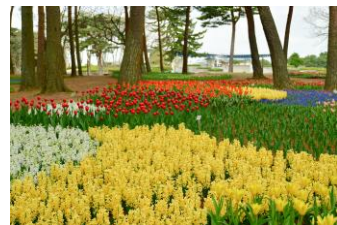
チューリップとヒヤシンスのエリア