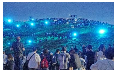
コキアライトアップ (2024年10月6日撮影)

11月以降は昨年度に引き続き、歴代上位となる入園者数となりました。11月・12月・1月は歴代1位（11月・1月は開園年を除く）、2月が歴代2位の入園者数を記録。海・花そとあそび（イベント）、干支の巨大地上絵、アイスチューリップの展示、期間限定ドッグランの開設など開催規模を拡大するなどし、魅力向上に努め認知度が増加したことが奏功しました。