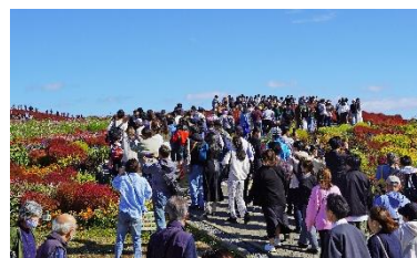
「みはらしの丘」秋の利用状況 (2024年10月20日撮影)

コキアの紅葉が見頃を迎えた 10月 は、361,857人（対前年比97.5%）と前年を若干下回りました。10月の歴代入園者数上位3位はすべてコロナ禍前となっておりますが、3年連続で30万人後半台を維持しており、復調の兆しが見えています。