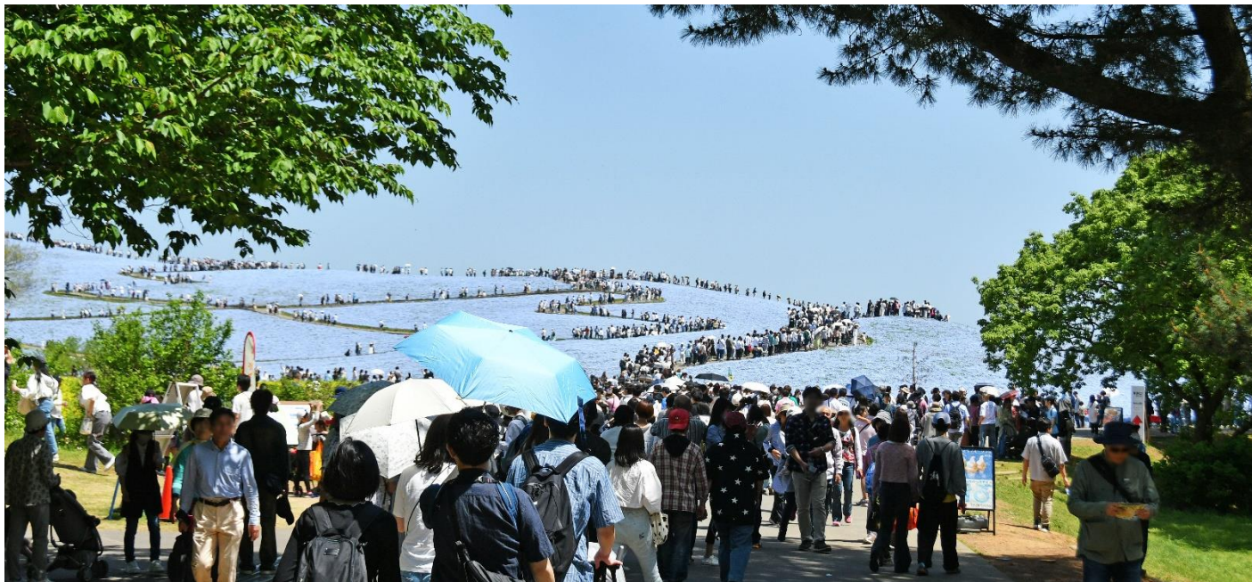
「みはらしの丘」春の利用状況 撮影/2024年4月28日

令和7年度も、安全・安心で多様な公園利用を提供するとともに、地元自治体や周辺施設との協働による地域全体の活性化を目指した公園運営に努めて参りますので、引き続き取材ならびに記事掲載のほど、よろしくお願い申し上げます。