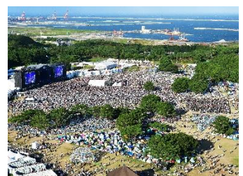
5年振りに本公園で開催された「ROCK IN JAPAN FES.」(2024年9月23日撮影)