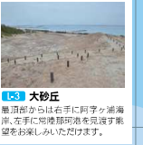
I.03 大砂丘 眺めるから上手にアザチが浦海。大砂丘に吹く潮風を見守る眺望をお楽しみいただけます。