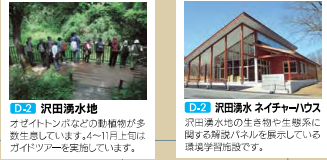
D.02 沢田湧水 沢田湧水の生きものや季節によって異なる景色が楽しめる展示施設です。ガイドツアーを実施しています。 D.02 沢田湧水 ネイチャーハウス 沢田湧水の生きものや季節によって異なる景色が楽しめる展示施設です。ガイドツアーを実施しています。