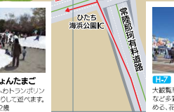
F.02 びよびんたまご 美しい山景のふもとにトンネルを飛ばした9つのカラフルな卵型の遊具が置かれています。※対象年齢3〜12歳