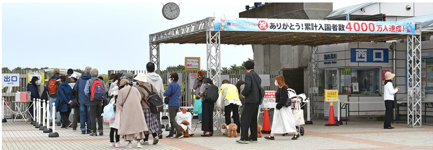
上：達成日のみはらしの丘 下：4,000万人達成の横断幕

国営ひたち海浜公園は、4月21日(日)に開園以来の累計入園者数が4,000万人を突破しました。これもひとえに本公園をご利用くださるお客様と、日頃よりご支援とご協力をくださる関係者の皆様のおかげと心より感謝いたします。