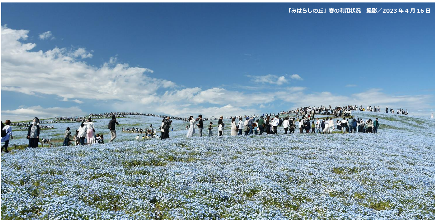
「みはらしの丘」春の利用状況 撮影/2023年4月16日

令和6年度も、安全・安心で多様な公園利用を提供するとともに、地元自治体や周辺施設との協働による地域全体の活性化を目指した公園運営に努めて参りますので、引き続き取材ならびに記事掲載のほど、よろしくお願い申し上げます。