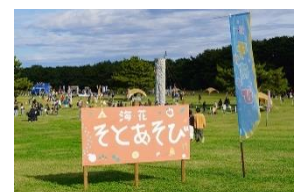
2回目の開催「海・花 そとあそび」 (2023年11月11日撮影)