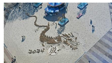
干支の巨大地上絵（2023年12月17日撮影）

11月以降は昨年度に引き続き、歴代上位となる入園者数となりました。11月は歴代1位（開園年を除く）、12月・2月が歴代2位、1月は歴代3位（開園年を除く）の入園者数を記録。平均気温の高さに加え、コキアの紅葉が例年より延伸したことや、海・花そとあそび（イベント）の開催規模拡大、干支の巨大地上絵やアイスチューリップの展示、期間限定ドッグランの開設など、魅力向上に努めたことが奏功しました。