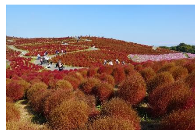
「みはらしの丘」秋の利用状況（2023年11月1日撮影）

ネモフィラ等が見頃を迎えた4・5月の入園者数は769,638人（対前年比100.4%）で前年とほぼ横ばい。コロナ禍前（R1）と比較すると、ネモフィラが5月1日以降、見頃過ぎとなったことや国内ツアー団体利用が44.3%まで減少したこと等により、71.2%に留まりました。コキアの紅葉が見頃を迎えた10月は、371,081人（対前年比97.8%）と前年を若干下回りました。コロナ禍前（R1）との比較では、国内ツアー団体利用が75.1%まで減少したものの、コキアの紅葉が延伸したことや茨城デスティネーションキャンペーン（10/1-12/31）の後押し等により、138.4%まで増加となりました。