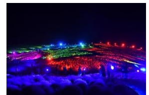
4年振り8回目の開催「コキアライトアップ」 (2023年9月24日撮影)