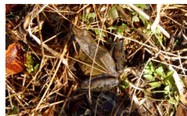
ニホンアカガエルの成体 (2023年2月12日撮影)