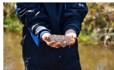
ニホンアカガエルの卵 (2023年3月5日撮影)