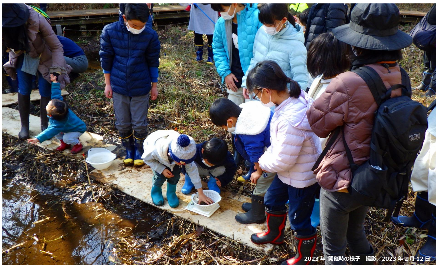
2023年開催時の様子 撮影/2023年2月12日

国営ひたち海浜公園の「沢田湧水地」では、 2月18日(日) に“ニホンアカガエルの卵をさがそう”を開催します。普段は立ち入ることができない自然保護区として、多様な動植物が生息する“生き物の宝庫”「沢田湧水地」での特別な観察会。公園ボランティアと一緒に池をのぞき込みながら、寒い時期に産卵するニホンアカガエルの卵を探します。見つけた卵塊に直接触れて観察することで、 図鑑や写真を見るだけでは得ることができない自然体験 ができます。