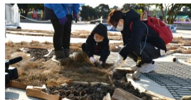
制作体験の様子（2022年12月11日撮影）