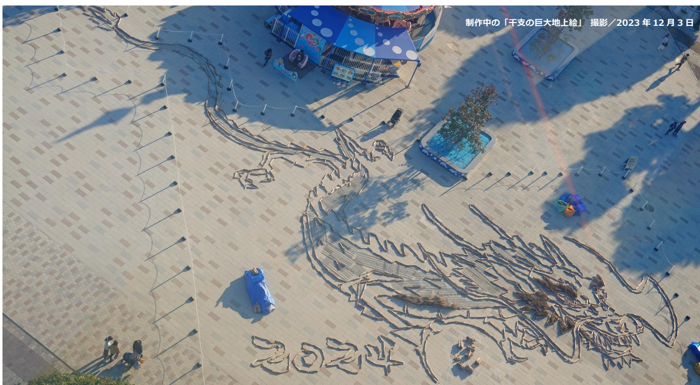
制作中の「干支の巨大地上絵」 撮影／2023年12月3日

国営ひたち海浜公園の「大観覧車前（プレジャーガーデン）」では、年末年始の風物詩「干支の巨大地上絵」を制作中です。今回は約3週間の制作期間で、全体サイズ「縦:30m×横:36m」の「天から舞い降りる龍」を描きます。地上絵を描く材料には、刈取り後のコキアや松の間伐材、松ぼっくりなどの自然素材を使用。現在は輪郭が完成した段階で、12月16（土）からの公開に向けてコキアや松ぼっくりを敷き詰めていきます。