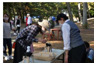
出張！記念の森レストハウス

バーベキュー広場では、キャンプ初心者や親子連れでも気軽に楽しめる、食体験プログラムが充実しています。大子町産の奥久慈りんごを使った焼きリンゴ体験やお米を使った手焼きせんべい体験、茨城県産のお米を使ったメスティン炊飯体験など、こだわりの食体験が盛りだくさんです。また、公園内のカフェ「記念の森レストハウス」からはバリスタが出張し、カップオンコーヒーの美味しい淹れ方講座も実施します。木漏れ日が差し込む自然豊かな空間で、自分で作って食べる食体験を是非ご堪能ください。