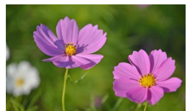
コスモス（2023年10月12日撮影）

【コスモス】 ■見頃:10月20日から31日頃まで ■品種数:5品種 ■本数:約265万本 ■場所:みはらしの丘 ■植栽面積:約2.3ha