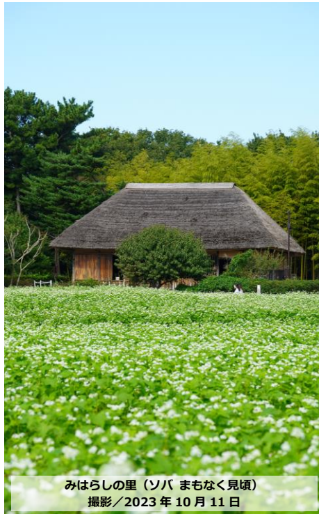
みはらしの里（ソバ まもなく見頃） 撮影/2023年10月11日