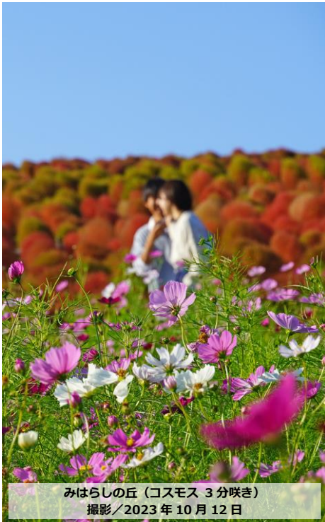
みはらしの丘（コスモス 3分咲き） 撮影/2023年10月12日

国営ひたち海浜公園の「みはらしの丘」では、約265万本のコスモスが10月14日から3分咲きとなります。10月20日には見頃（7分咲き）を迎え、見頃は31日頃まで続く予想です。また、「みはらしの里」では約76万本のソバが10月14日に見頃を迎え、見頃は26日頃まで続く予想です。丘のふもとを華やかに彩る“赤・白・ピンク”のコスモスと“純白”のソバ。まもなく丘一面を紅葉で赤く染めるコキアとの秋の共演をご覧ください。