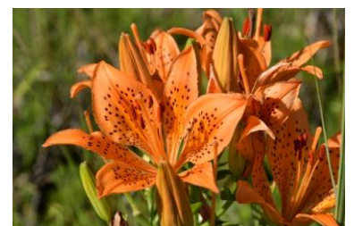
スカシユリ（2022年7月7日撮影）