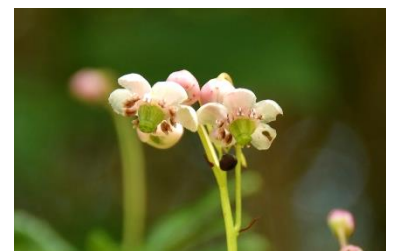
オオウメガサソウ（2023年5月30日撮影）