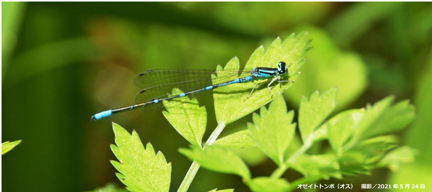
オゼイトトンボ（オス） 撮影/2021年5月24日

国営ひたち海浜公園の「沢田湧水地」では、細い体と美しく鮮やかな水色が特徴の「オゼイトトンボ」が飛び始めました。オゼイトトンボは湿原的な沼地や湧水がでるような小川などに生息し、茨城県版レッドデータブック（2016）では準絶滅危惧に選定されている希少なトンボです。普段は立ち入ることができない沢田湧水地の自然保護区に生息しているため、公園ボランティア「沢田湧水地パートナー」が案内する「沢田湧水ガイドツアー」に参加することで観察できます。