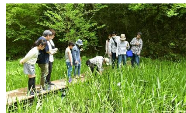
ガイドツアーの様子（2023年4月29日撮影）