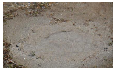
砂からわき出す湧水（2021年5月24日撮影）