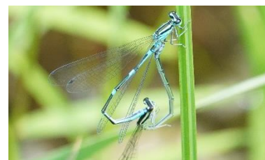
ハート型になる交尾（2020年6月6日撮影）

日本固有種のオゼイトトンボは、イトトンボ科エゾイトトンボ属で、体長3.3～3.8cmのイトトンボです。オスは羽化直後の白っぽい体色が、成熟に伴って腹端から水色に染まっていき、黒と水色の反復模様になります。メスは羽化直後の褐色がかっている体色が、成熟すると若草色になる個体と水色になる個体に分かれます。成虫は5～7月に出現し、北海道、新潟、長野、群馬、栃木、茨城県以北の地域に局所的に分布。沢田湧水地は南限生息地のひとつとなっています。