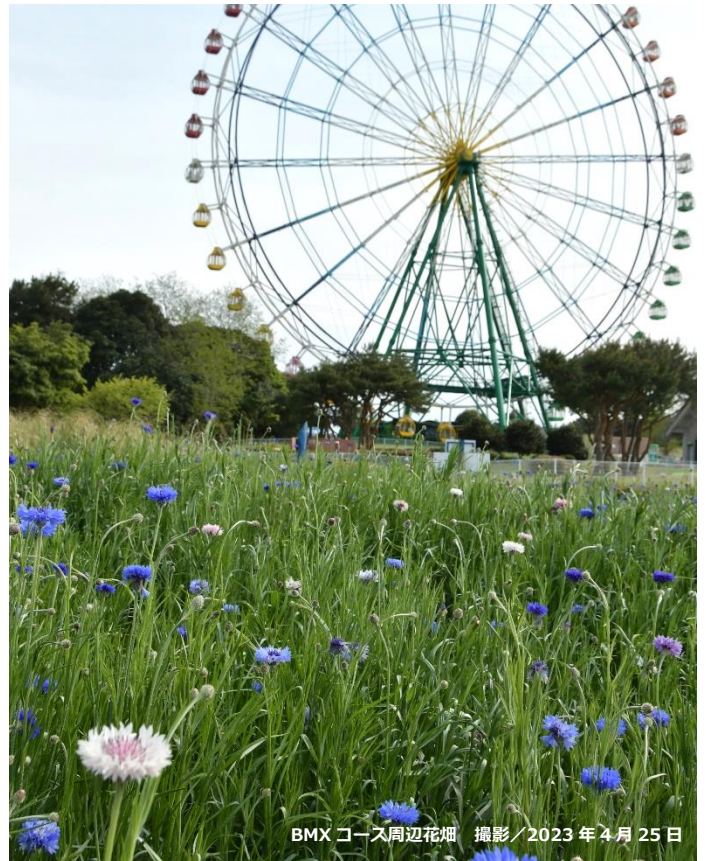
BMXコース周辺花畑 撮影/2023年4月25日