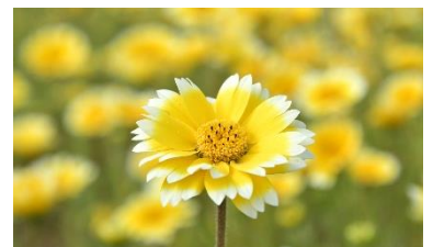
ツマジロヒナギク (2023年4月25日撮影)