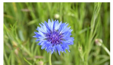
ヤグルマギク (2023年4月25日撮影)

Information ネモフィラは、4月30日まで「見頃(後半)」で、花数が比較的多く楽しめる見込みです。