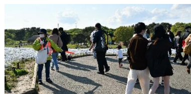
「みはらしの丘」誘導案内（2022年5月3日撮影）

12月以降は昨年度に引き続き、歴代上位となる入園者数となりました。第8波の到来など、感染状況は思わしくなかったものの、1月は歴代1位（開園年を除く）、12月・2月が歴代2位の入園者数を記録。平均気温の高さに加え、園内2箇所でのアイスチューリップ展示や期間限定ドッグランの新設など、魅力向上に努めたことが奏功しました。