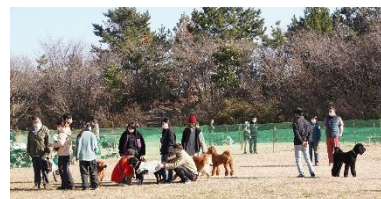
特設ドッグランの利用状況（2023年1月9日撮影）