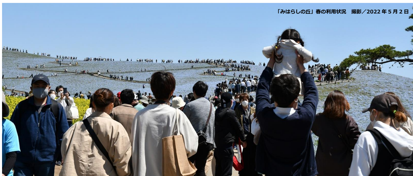
「みはらしの丘」春の利用状況 撮影/2022年5月2日

令和5年度も感染状況を注視しつつ、安全・安心で多様な公園利用を提供するとともに、地元自治体や周辺施設との協働による地域全体の活性化を目指した公園運営に努めて参りますので、引き続き取材ならびに記事掲載のほど、よろしくお願い申し上げます。