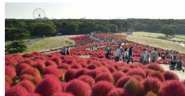
「みはらしの丘」秋の利用状況（2022年10月16日撮影）