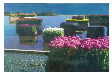
見頃のアイスチューリップ(グラスハウス) 撮影/2022年12月15日