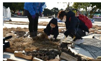
制作体験の様子（2022年12月11日撮影）