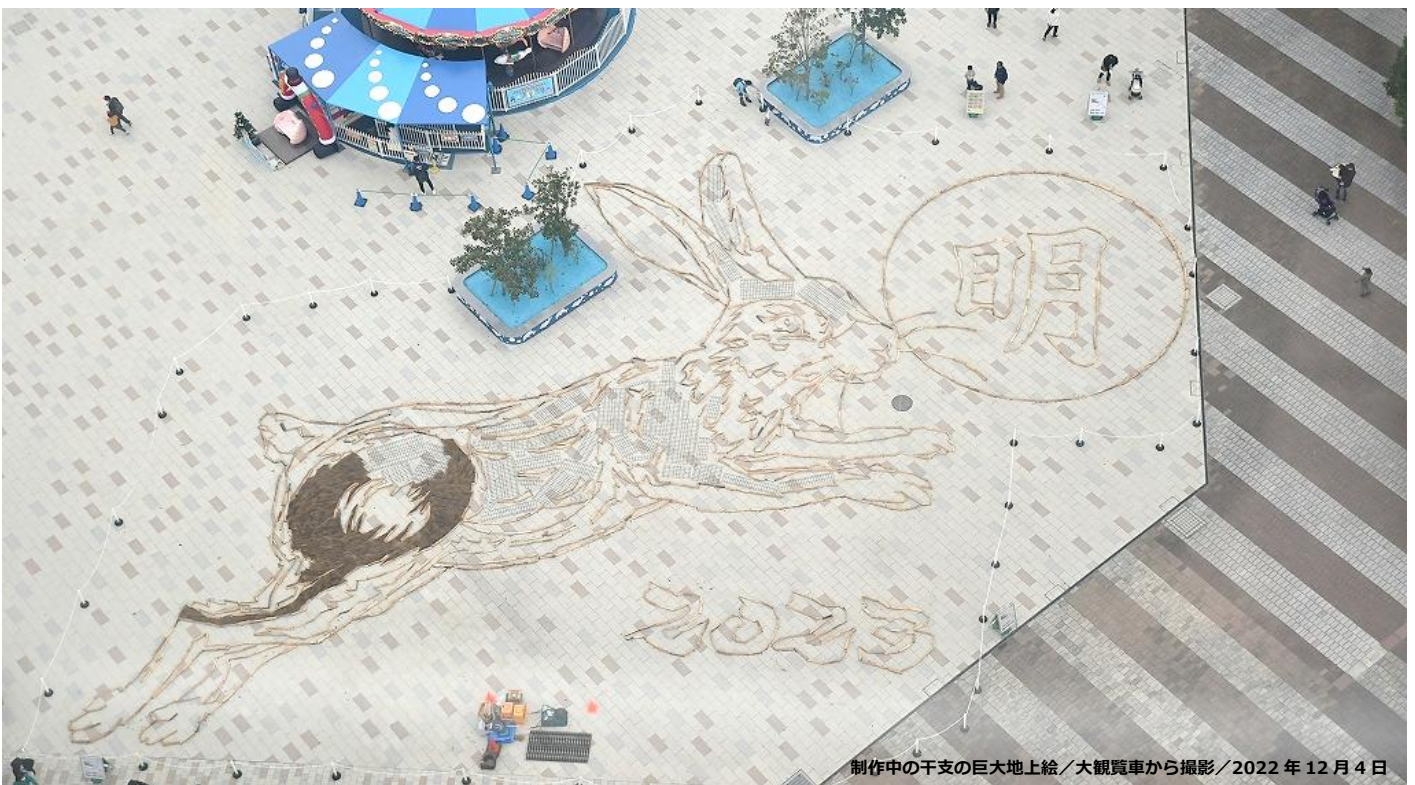
制作中の干支の巨大地上絵／大観覧車から撮影／2022年12月4日

国営ひたち海浜公園の「大観覧車前（プレジャーガーデン）」では、年末年始の風物詩となった「干支の巨大地上絵」を制作中です。材料には、刈取り後のコキアや松の間伐材、松ぼっくりなどの自然素材を使用。今回は、全体サイズ「縦25m×横33m」の「天高く飛び跳ねる兎」を描きます。現在は輪郭が完成した段階で、12月17日（土）の公開に向けてコキアや松ぼっくりを敷き詰めていきます。