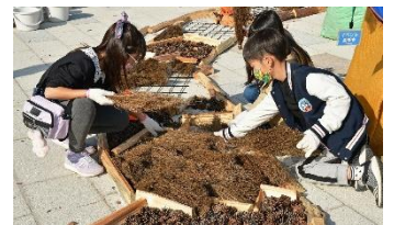
制作体験の様子（2021年12月12日撮影）