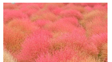
深みと趣ある赤 (2022年10月19日撮影)

■品種数:4品種 ■本数:約283万本 ■場所:みはらしの丘 ■植栽面積:約2.3ha