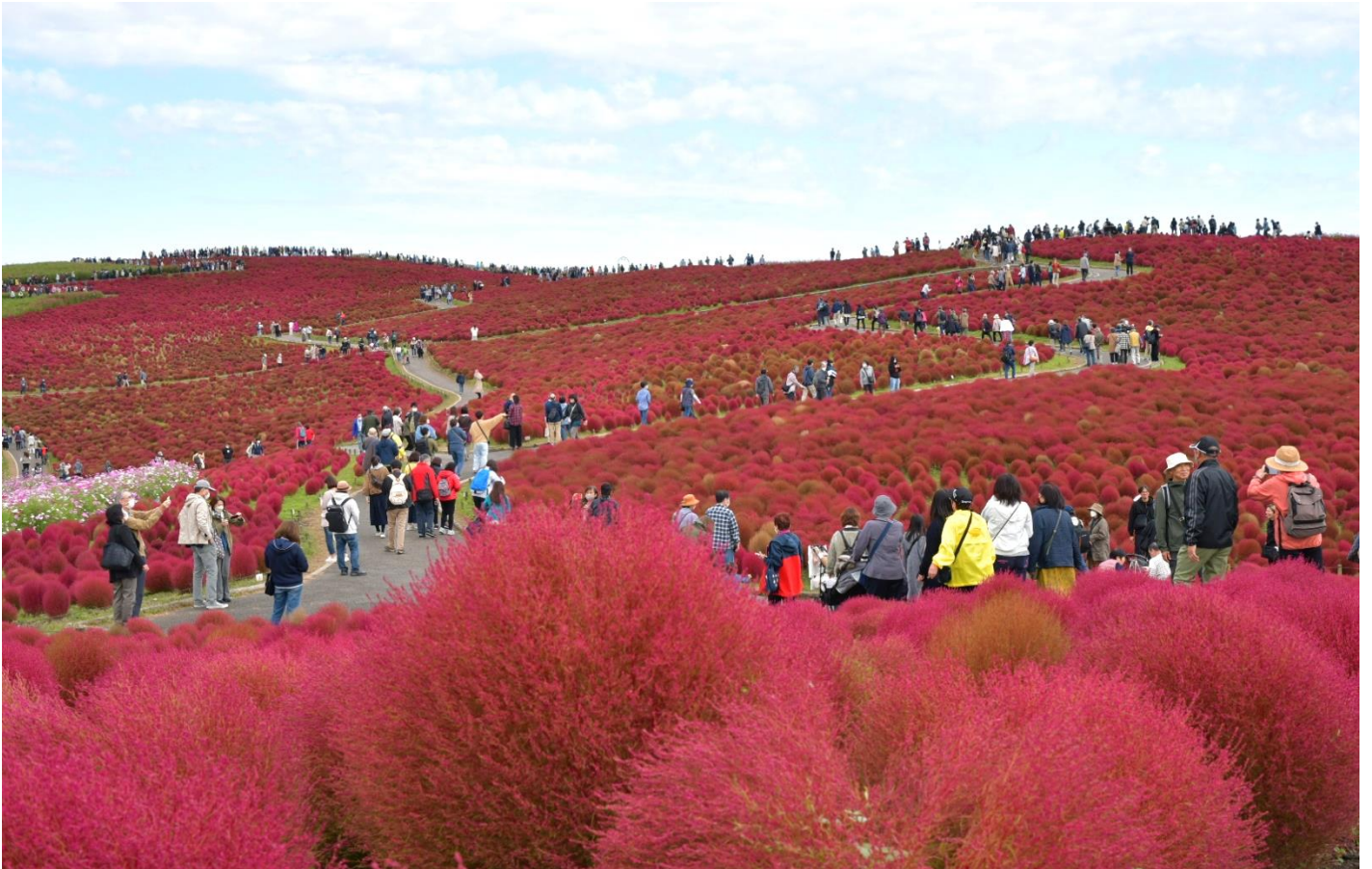
コキア 紅葉見頃（後半） 撮影/2022年10月19日

国営ひたち海浜公園の「みはらしの丘」では、約3万3千本のコキアが「紅葉見頃（後半）」となりました。18日まで「紅葉見頃」のピークを迎えていたコキアは、19日から23日頃までの間、赤と茶色が織りなすグラデーションをお楽しみいただけます。丘一面の赤一色から、徐々に赤煉瓦のような赤茶色が混ざり、茶色へと変化していく様は、晩秋の兆しを感じさせてくれるとともに、シックで深みのある美しさがあります。