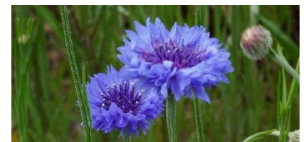
ヤグルマギクの花