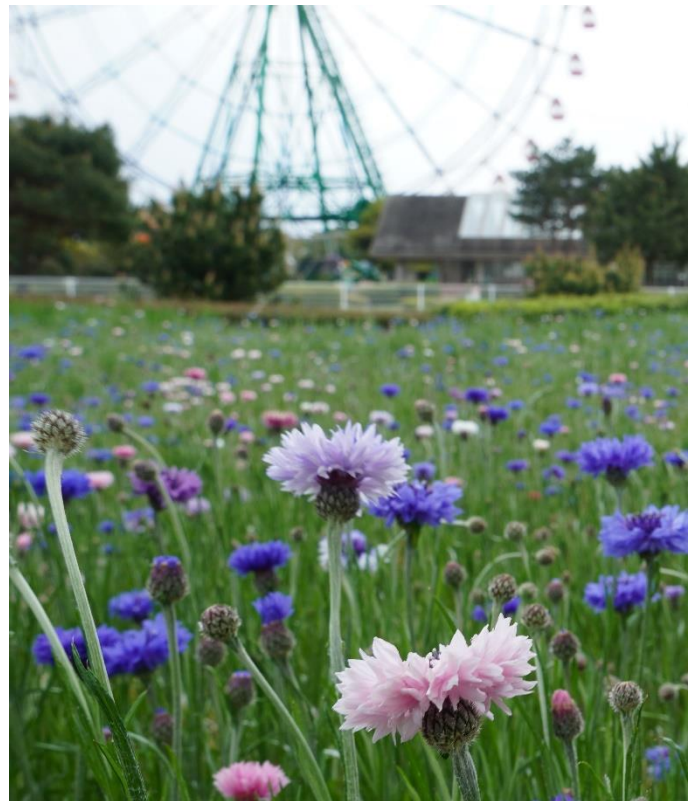
ヤグルマギク (2021年4月17日撮影)