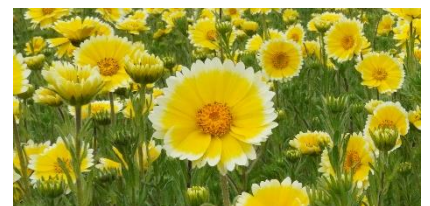
ツマジロヒナギクの花