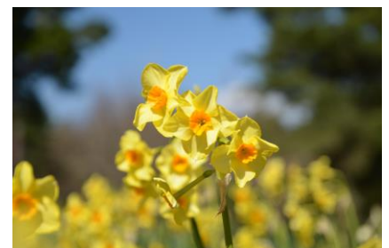
ジョンキラスイセン「ラッパ」:7Y-O(2020年3月25日撮影)

本公園の大規模花修景の先駆けとなったスイセン。開園3年目の平成5年に、公園の砂質土壌に適した球根植物“スイセン”による花修景が始まりました。その後、平成12年にチューリップ、平成14年にネモフィラの花修景を開始し、現在の春のフラワーリレーとなっています。