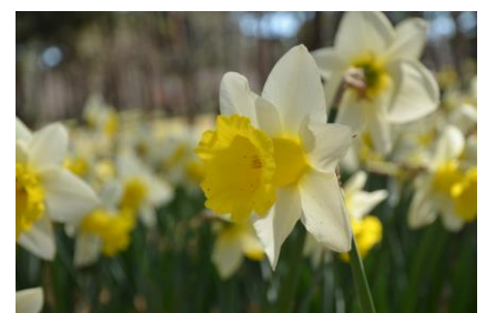
ラッパスイセン「コーニッシュキング」:1W-Y(2020年3月25日撮影)