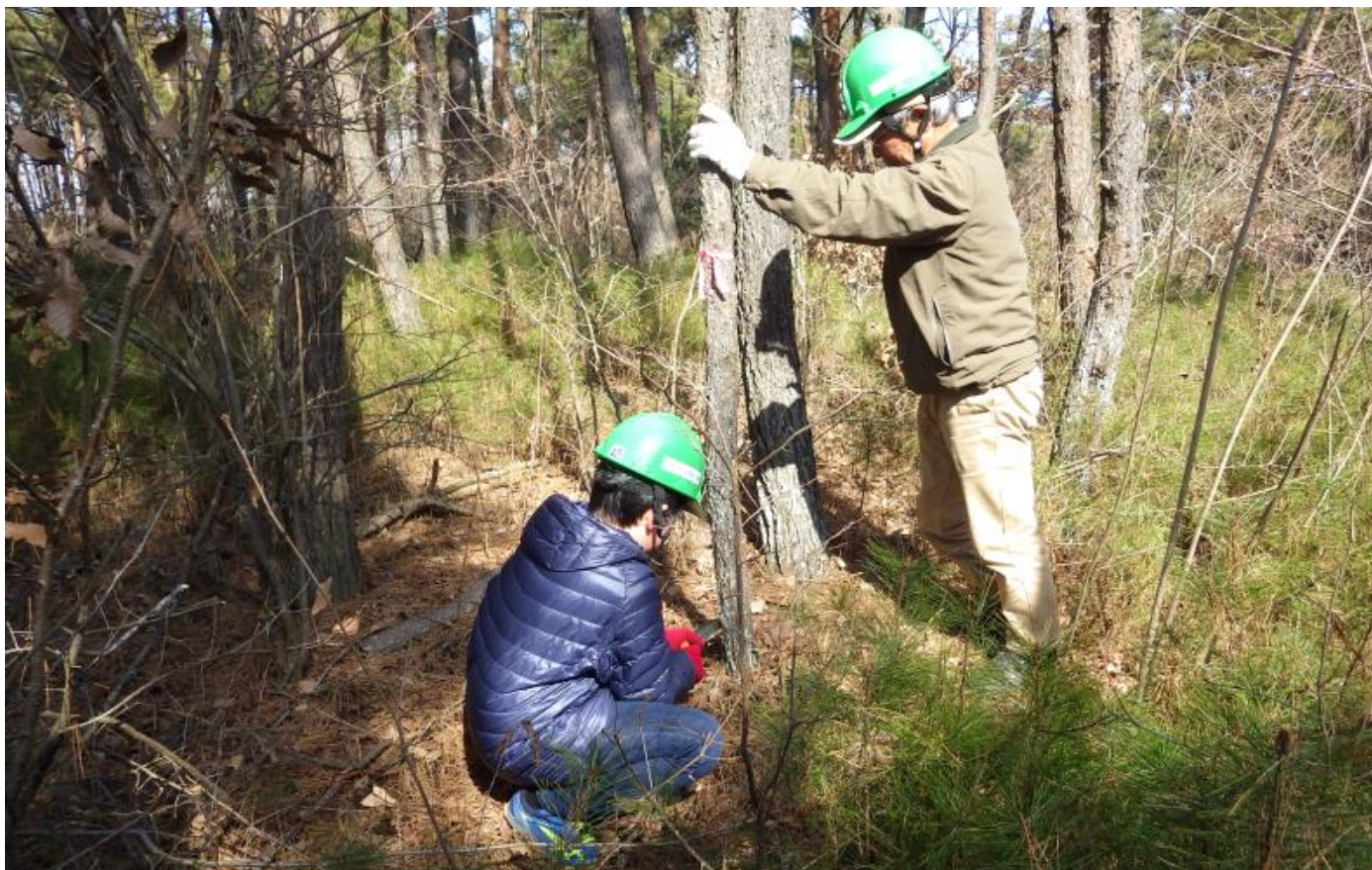
「里山管理体験」開催の様子 撮影/2019年2月24日

国営ひたち海浜公園では、2月23日(日)に樹林エリアの「ひたちなか自然の森」をフィールドとして「里山管理体験」を開催します。公園ボランティア「里山パートナー」の皆さんと共に、ノコギリや剪定バサミを使って「木を切る作業」を体験することができます。ヘルメットなどの保護具や道具の用意もあり、安全で気軽にご参加いただけます。