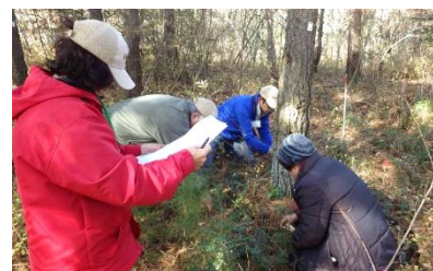
「里山パートナー」の活動の様子 撮影/2018年12月20日

「里山パートナー」は、オオウメガサソウの保全を目的とし、里山林の管理作業を行う公園ボランティアです。活動は大きく2つに分けられ、下草刈りや、除伐、間伐作業等と、オオウメガサソウ生育地の調査を行っています。オオウメガサソウが開花する6月上旬~中旬頃には、ガイドツアーも開催しています。