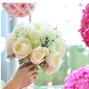
アートフラワーのブーケ