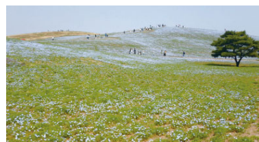
咲始め began to bloom