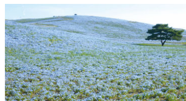
5分咲き 50% in bloom