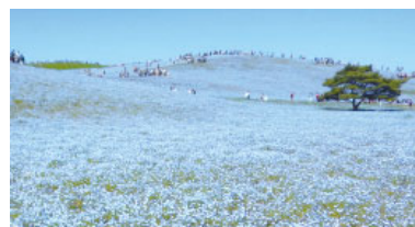
見頃 (後半) good (past the peak)