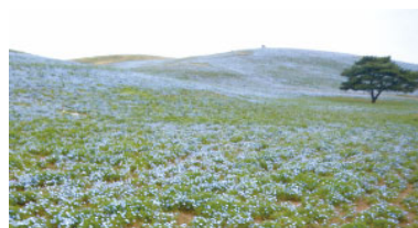
3分咲き 30% in bloom