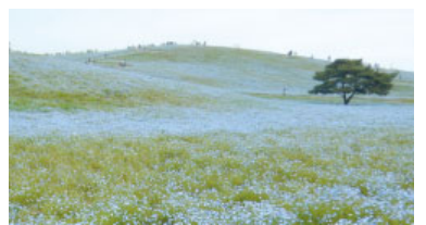
見頃過ぎ the peak is gone