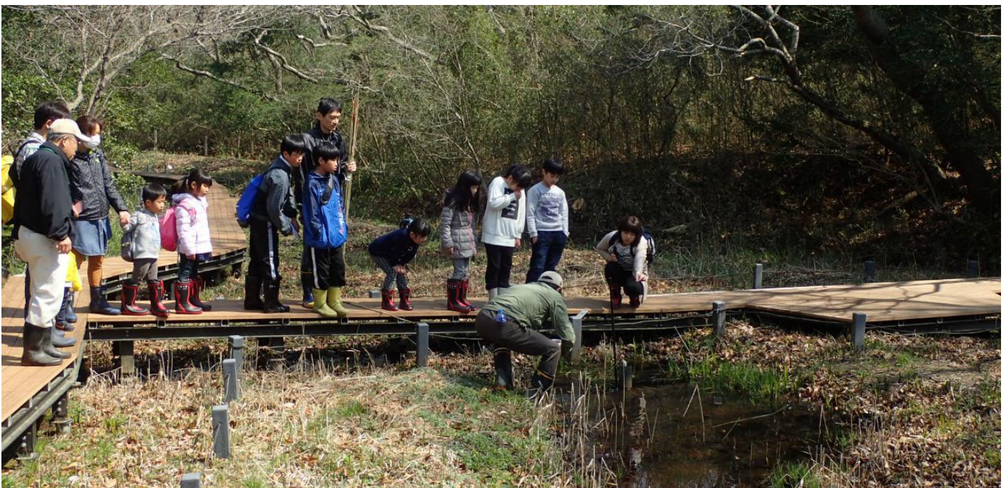
開催風景/2018年3月25日撮影

みはらしの丘の北側に位置する「沢田湧水地」では、自然保護区を特別に公開するガイドツアーを開催しています。今回は特別編として、寒い時期に産卵する「ニホンアカガエルの卵塊」を探す、期間限定ツアーとなります。運よく産まれたばかりの卵塊が見つければ、触ってみることも。ゼリー状で“プルプル”の卵塊は、ぜひ子どもたちに体験してほしい触感です。