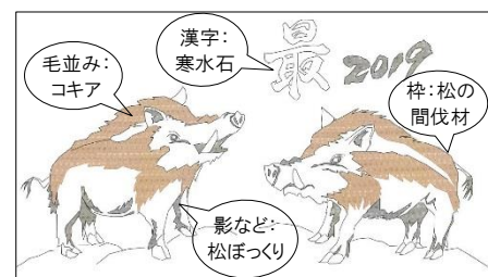
「亥（いのしし）」デザイン図