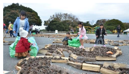
仕上げはみんなで（2018年12月2日撮影）

大観覧車からの撮影は午前中がおすすめ。観覧車の正面から見て Gondola が10～11時の位置に上がったときがベストタイミングです。窓ガラスは反射しやすいので、カメラをギリギリまでガラスに近づけると、きれいに撮影できます。