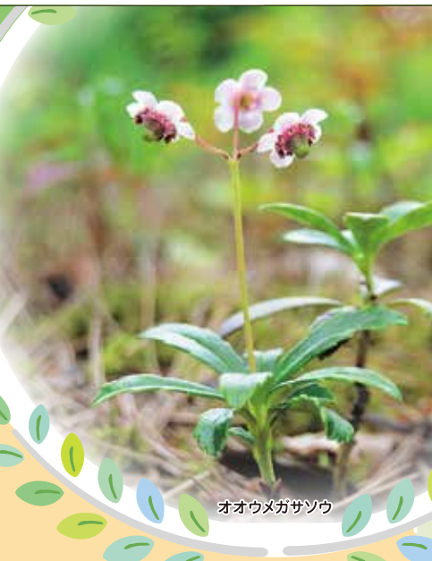
オオウメガサソウ

10:00～15:00 管理センター多目的ホール 50名 協賛 茨城生物の会、パークパートナー