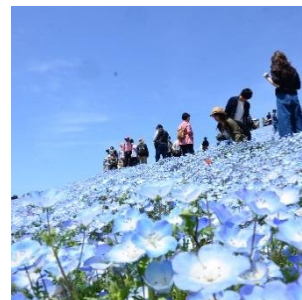
ネモフィラ 4月中旬～5月上旬 みはらしの丘