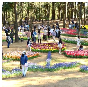
チューリップで描いた模様