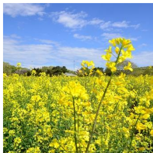
ナノハナ 4月中旬～下旬 みはらしの里