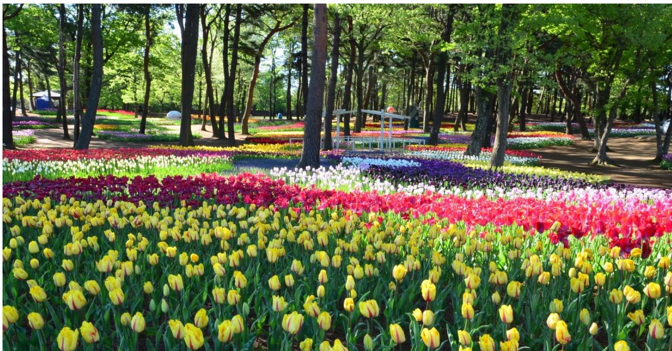
昨年の様子 2017年5月2日撮影