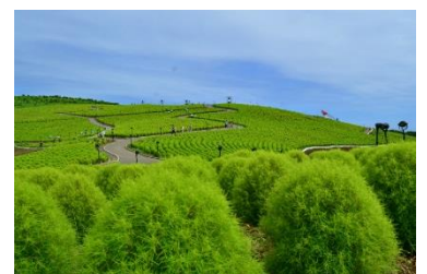
夏の緑葉コキア(2017年8月17日撮影)

特に春はGW期間にネモフィラが見頃を迎えたことに加え、“インスタ映え”に代表されるSNSによる話題、共感の広まりも追い風となり、連日多くの方にご来園いただいた結果、4月、5月、6月の入園者数が過去最高を記録しました。また、秋の紅葉期以外の緑葉のコキア人気が高まり、8月も過去最高となりました。