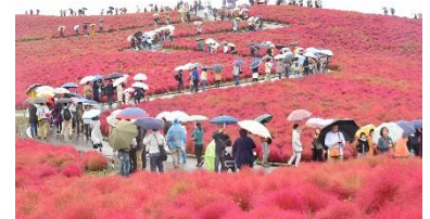
コキア紅葉見頃(2017年10月15日撮影)

国内外含めたツアー団体利用件数が、年間で過去最高の3,993件・155,673人を記録しました。特に、4月、5月、10月で年間利用の約9割を占めており、台風と長雨により入園者数が前年度の2/3にとどまった10月については、ツアー団体利用が下支えとなったこともあり、結果的に歴代3位の入園者数となりました。