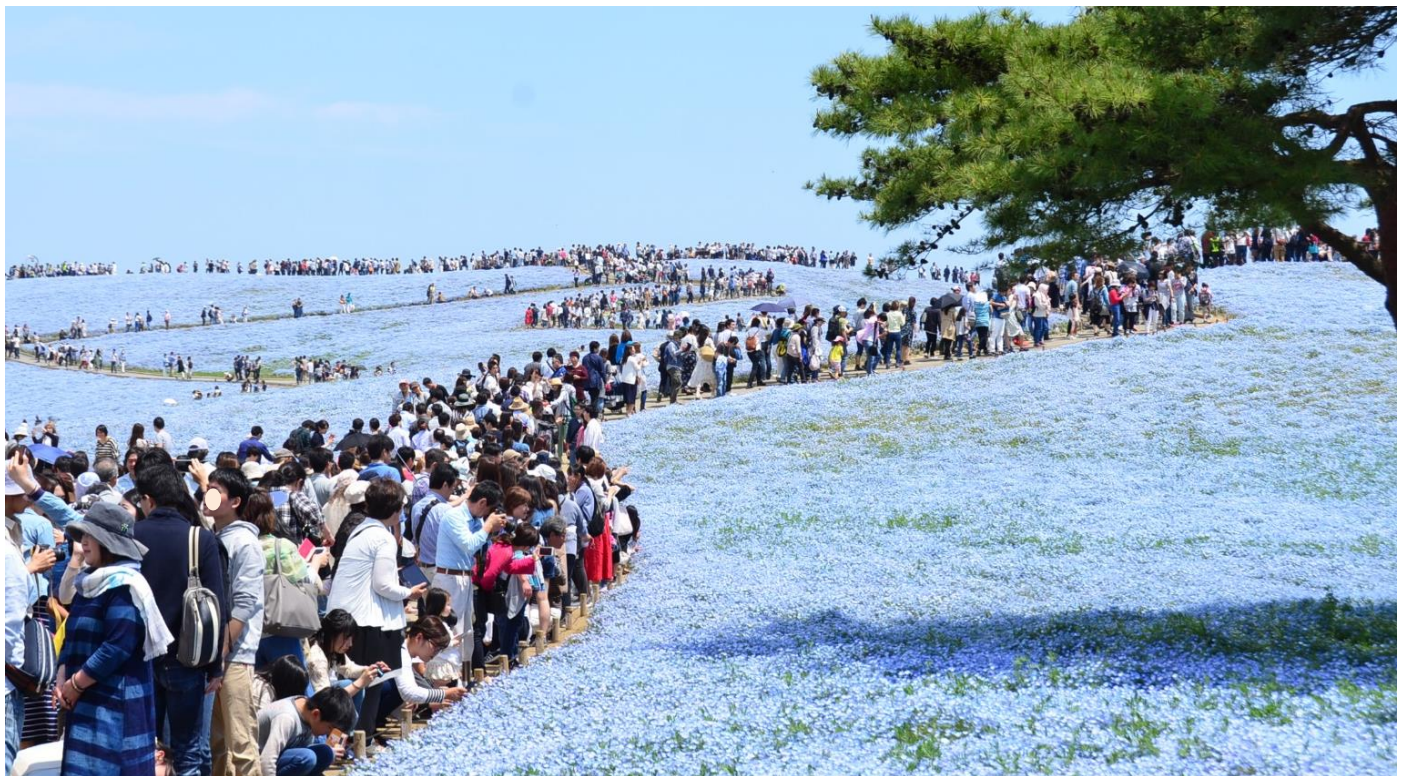
大勢の来園者で賑わうみはらしの丘 撮影/2017年5月5日

平成29年度、国営ひたち海浜公園の年間入園者数が、 2,278,061人 となり、 3年連続で200万人 を超えるご来園がありました。平成27年度の記録（2,136,668人）を141,393人上回る過去最高の入園者数となりました。今後もお客様にご満足いただけるよう改善に努めるとともに、地元自治体や周辺施設と協力し、地域全体の活性化を目指して公園運営に努めてまいりますので、引き続き取材並びに記事掲載の程よろしくお願ひ申し上げます。