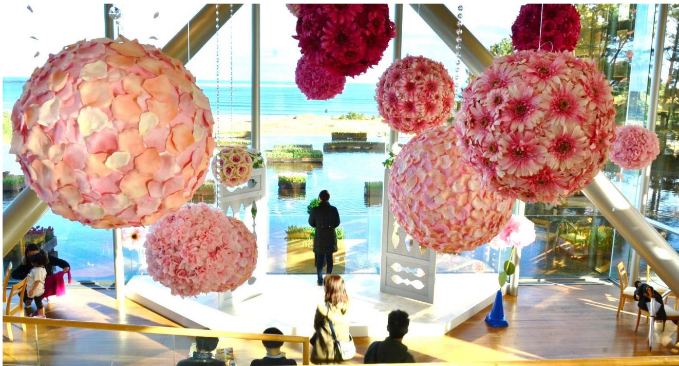
昨年の様子 2016年12月23日撮影