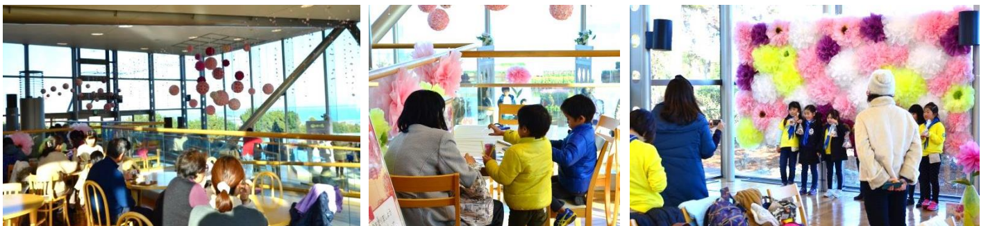
※昨年度の開催風景

左上から、装飾「Flower Fall」、装飾「Door to Pacific」、アイスチューリップ、装飾「Flower Wall」、パシフィックアートフラワーラリー、Sea Side Cafe