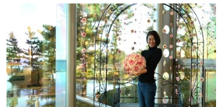
新設のフォトスポット（2017年12月13日撮影）

期間中の週末を中心に、花・香り・音楽をテーマにした各種イベントを開催。また、グラスハウス内カフェ「Sea Side Cafe」では、ティーグラスの中に花が浮かぶお茶“工芸茶”など、花にまつわる期間限定メニューも販売しています。施設内でゆったりとした時間を過ごしませんか。