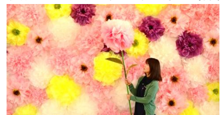
スケールアップした「Flower Wall」 （2017年12月13日撮影）