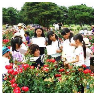
常陸ローズガーデンツアー

本公園の「常陸ローズガーデン」では、秋バラの見頃時期に合わせて、10月23日(月)より「茨城バラまつり」を開催いたします。イベント期間中は、深く濃い色合いと芳醇な香りが魅力の秋バラを堪能でき、ローズガーデンのガイドツアーやバラにまつわるクラフト体験などの各種イベントもお楽しみいただけます。