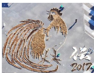
『昨年度の干支の巨大地上絵』