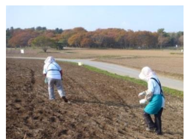
『ネモフィラ種まきの様子』