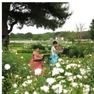
オータムローズコンサート