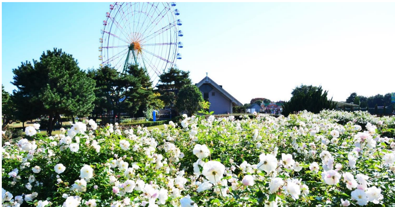
昨年の様子 2016年10月23日撮影