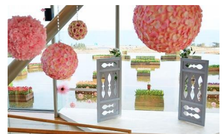
パシフィックアートフラワー展

「パシフィックアートフラワー展」のドアを開いた場所から撮影すると、青く広がる太平洋を背景に、開放感のあるカラフルな花風景をお楽しみいただけます。