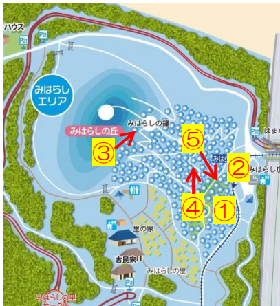
緑コキアフォトスポット MAP

第2 頂上からは、眼下に広がる一面のコキアたちが創り出す風景をご覧いただけます。まるでふわふわモコモコの緑色の絨毯のようです。遠くに見える丸い大観覧車も風景のアクセントに。