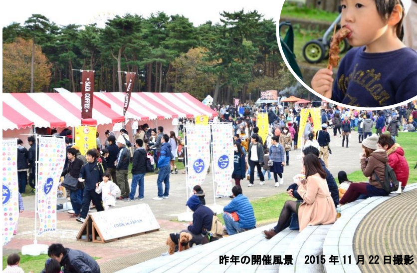
昨年の開催風景 2015年11月22日撮影