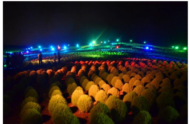
カラフルなライティングによって変化する、みはらしの丘の風景 2016年8月20日撮影

“ふわふわもこもこ”とした夏のコキアたち。現在、まばゆい日差しを受け、すくすくと生長中です。台風による被害も心配されましたが、無事乗り切ることができ、引き続き、爽やかなライムグリーンのコキアが創り出す夏風景をお楽しみいただけます。