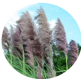
赤黒色 (はまかぜサークル)