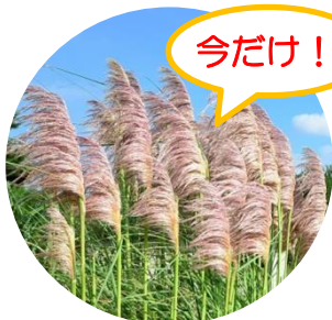
桃色 (大草原北東側)