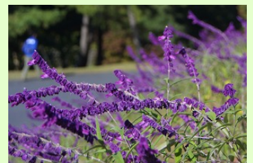
メキシカンブッシュセージ 10月中旬～11月下旬