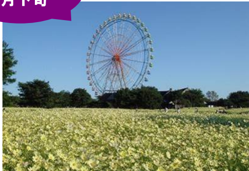
イエローガーデンの咲く第1ガーデン (昨年の様子)

24種の品種が次々花開く第2ガーデンは、一部の遅咲きの品種がこれから開花していきます。9月上旬から、鮮やかな黄色やオレンジ色のキバナコスモスを咲かせていた第3ガーデンでは、今回の台風の影響でだいぶ、花が散ってしまったため、「見頃過ぎ」となりました。