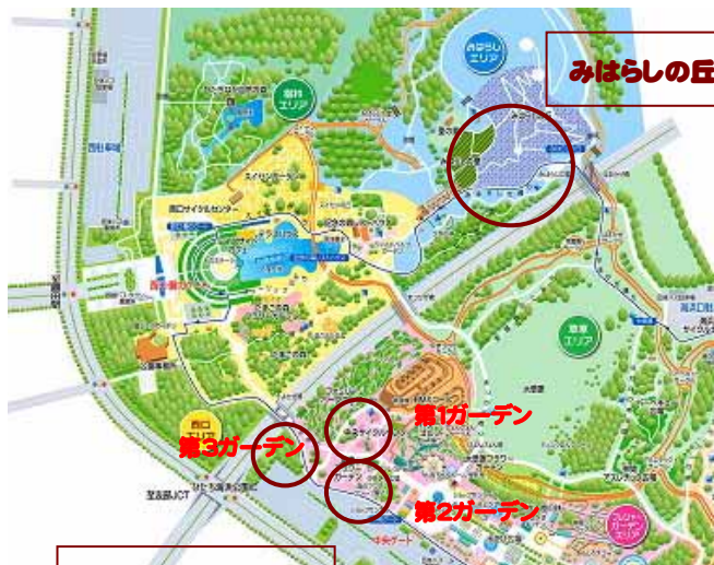
中央フラワーガーデン

県内最大級の黄色のコスモス畑は、海浜公園の自慢です。お客様から注目も最も高いコスモスです。