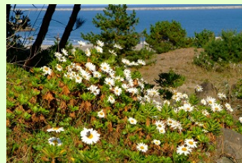
ハマギク 10月上旬～11月上旬