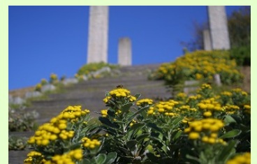
イソギク 11月上旬～11月下旬