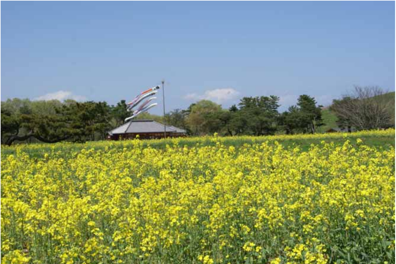
「里の家」平成 21 年 4 月 22 日撮影

国営ひたち海浜公園では、なつかしいかつての農村風景を再現した「みはらしの里」の整備を進めています。これにあわせて、常陸地方の風土、歴史、文化について学び親しんでいただくことを目的として、「みはらしの里講座」を開講します。