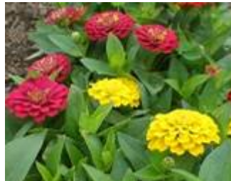
ジニータ 半球形で、小輪、八重咲き。赤・黄・橙・白などの花をミックスで植栽している。