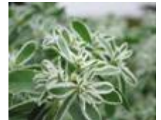
【和名：初雪草】トウダイグサ科ユーフォルビア属

今年新たに、カラフルなジニアの花をより鮮やかに引き立てる「ユーフォルビア」をジニアの周囲に植栽しました。白い縁取りのある葉を楽しむ、涼しげな印象の植物です。