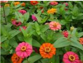
プルチノ 多くの花卉が重なりあって咲く万重咲き。赤・黄・橙・白などの花をミックスで植栽している。

高性種で草丈 80cm にもなる No.17・21 や 20cm 程度の矮性種のマゼランまで、草丈も様々。