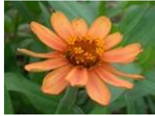
プロフージョン (一重咲き)