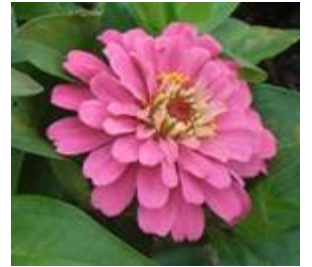
マゼラン 矮性で大輪種。八重咲き。3 色を単色で植栽している。