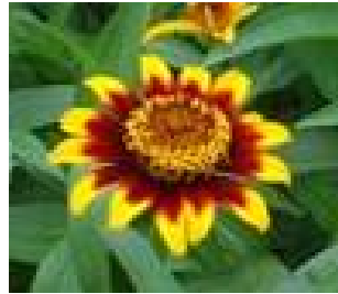
オールドファッション 黄色から暗褐色のコントラストが美しい 2 色咲き。一重から八重咲きまで変化に富む。