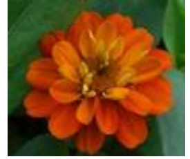
プロフージョン (八重咲き) 一重から八重咲きまで変化に富み、色も豊富。単色で植栽している。