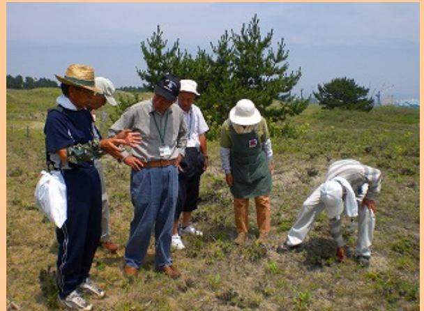
海浜植物パートナー活動風景 平成21年7月3日撮影

特に、スカシユリについては重点的に取り組み、球根の増殖、植え付けなどを行っています。