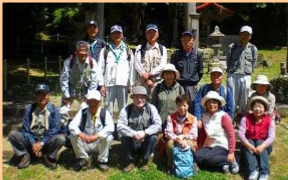
海浜植物パートナーの皆さん 平成21年5月15日撮影