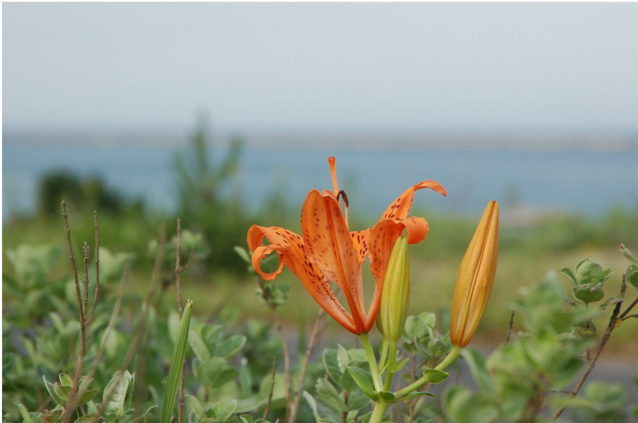
スカシユリ 平成 21 年 7 月 7 日撮影