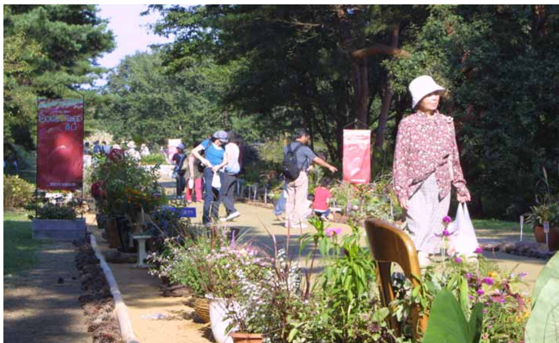
昨年度展示の様子（平成十九年十月七日撮影）