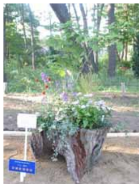
フリー部門「茨城県知事賞」