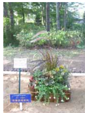
スモール部門「茨城県知事賞」