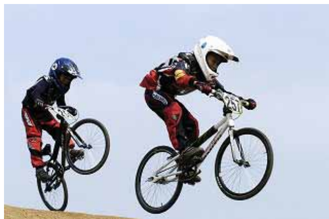
世界を目指してジャンプ！