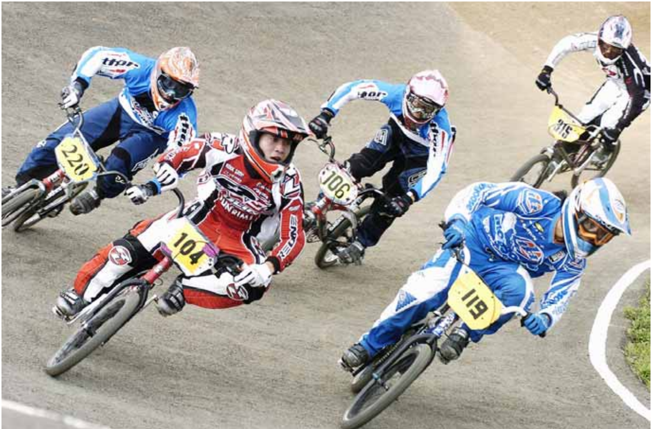
撮影:平成19年8月26日開催「東日本BMX選手権大会 in ひたち海浜公園」

第9回 国営ひたち海浜公園杯争奪戦 2009 UCI BMX 世界選手権オーストラリア大会代表選手選考会