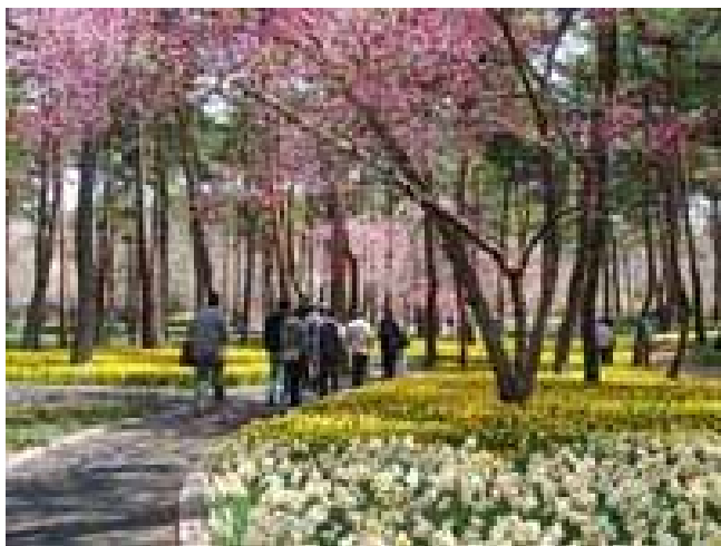
スイセンガーデン (撮影: 平成20年4月5日)