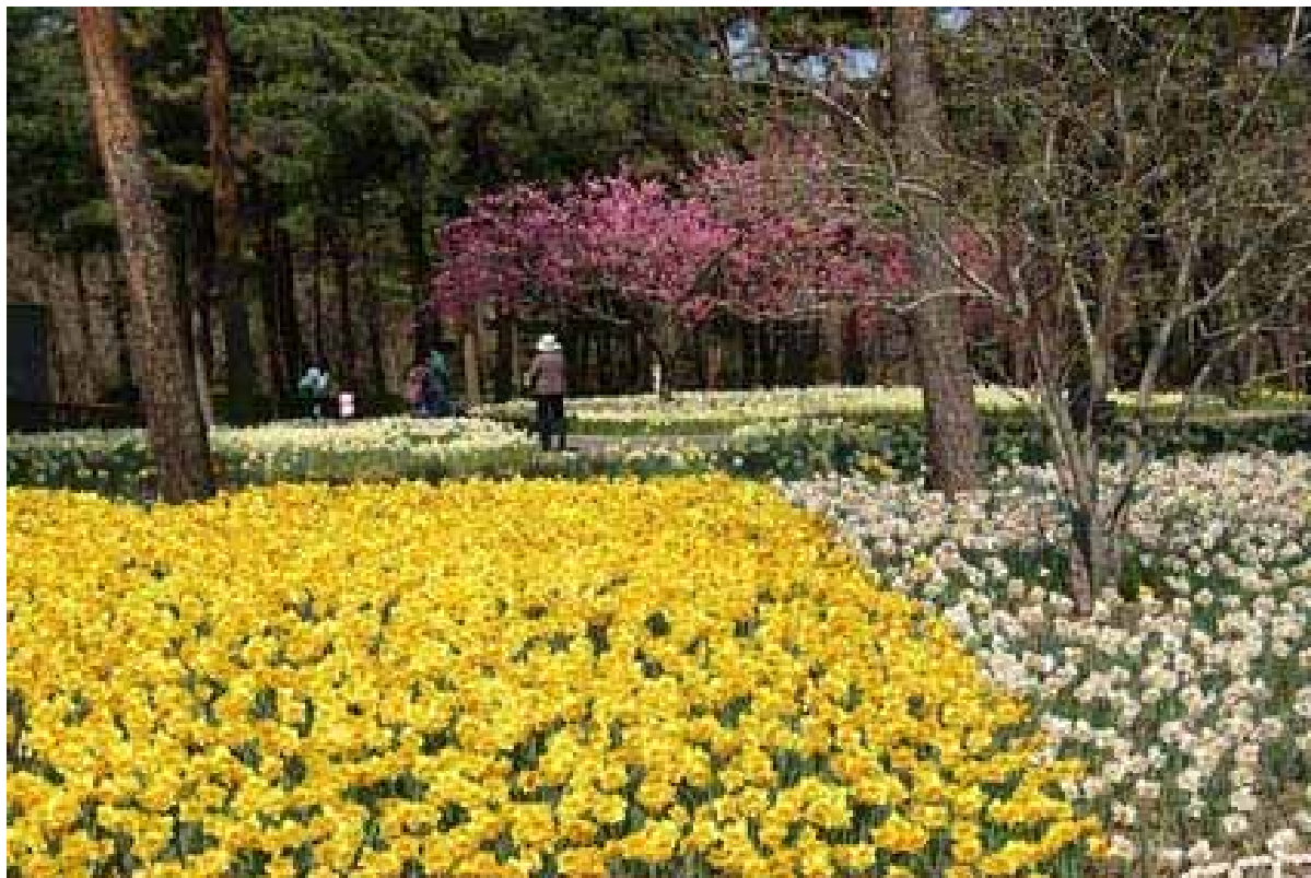
スイセンガーデンにて(撮影:平成20年4月5日)

つきましては、皆様には御多忙中のことと存じますが、取材並びに記事掲載の程何卒よろしくお願い申し上げます。 謹白