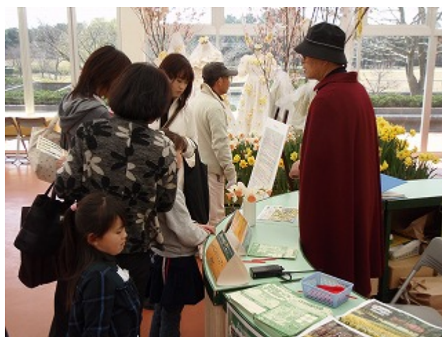
スイセンガイド (撮影: 平成20年4月1日)