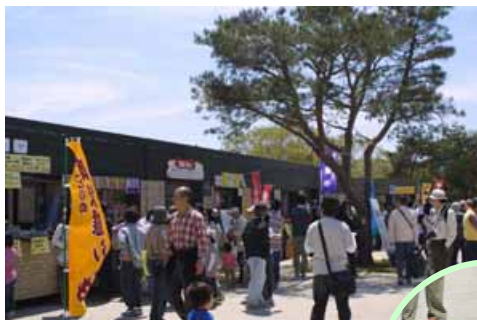
ボリューム満点!! “ハム焼き”