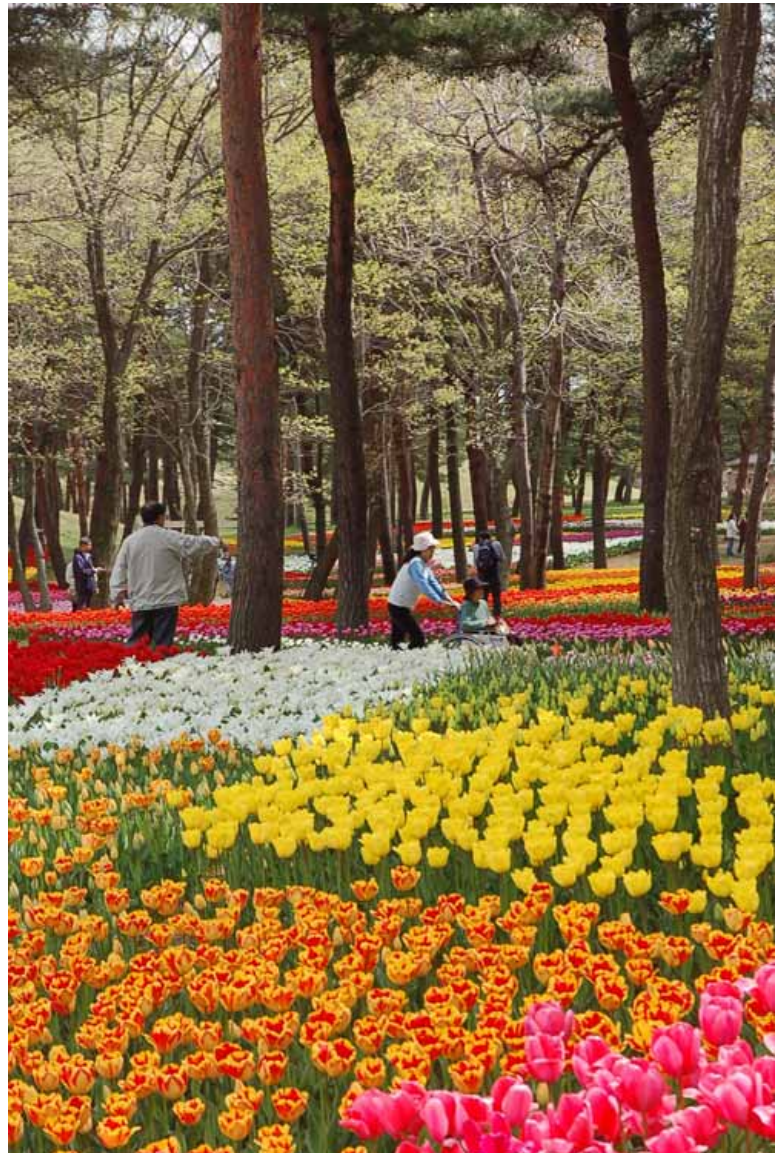
(撮影:平成 19年 4月 22日)

つきましては、皆様には御多 忙中のことと存じますが、取材 並びに記事掲載の程よろしく お願い申し上げます。 謹白