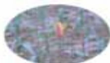
クリサンタ TU ジェム