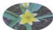
ティティーズスター