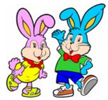
モデル:花ちゃんと海くん

開催日 平成18年3月18日(土) 10:00～12:00 デモンストレーション 12:00～17:00 記念写真コーナー