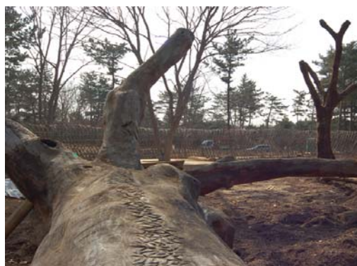
撮影：平成18年3月8日 ひなの林 (左/倒木遊具 右/メインツリー)