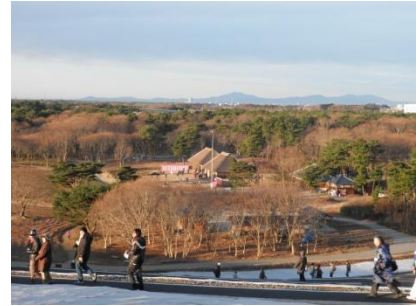
みはらしの里、古民家