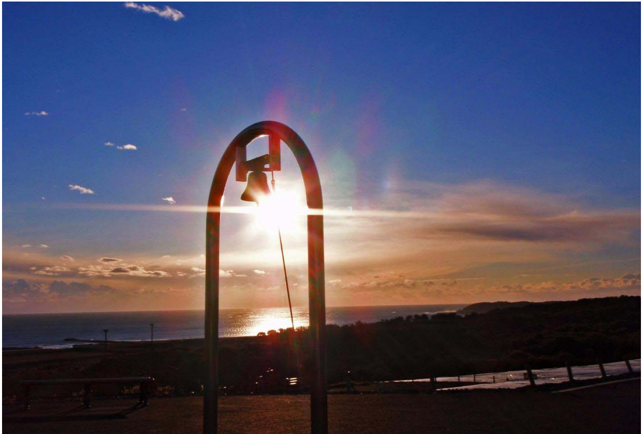
「みはらしの丘から望む初日の出」 2011年元旦 撮影

国営ひたち海浜公園では、閉園日の平成24年1月1日元旦に特別開園し、『海浜公園で初日の出』を開催いたします。ひたちなか市で最も高い標高58メートルの「みはらしの丘」から初日の出を望むイベントです。丘に登ると眼下に太平洋が広がり、その水平線から現れる初日の出と、ひたちなか市を一望できる360度の展望がお楽しみいただけます。