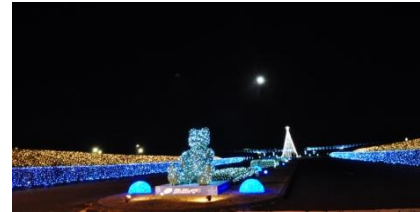
ひたち海浜公園イルミネーション