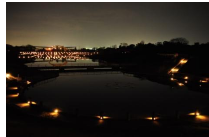
西池のライトアップ