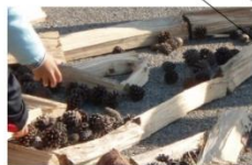
まつぼっくり、アカマツの間伐材 22,000 個のまつぼっくり