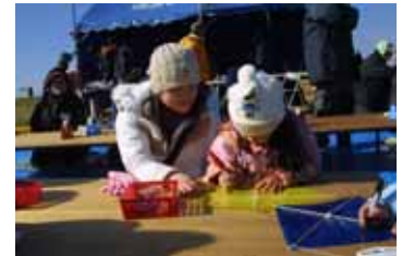
日本のお正月はやっぱり凧!