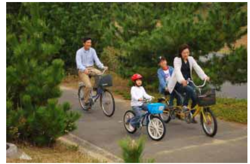
サイクリングで体もほっかぽか!