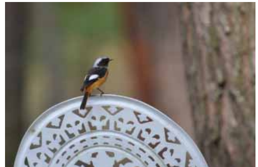
ジョウビタキにも会えるかも!?