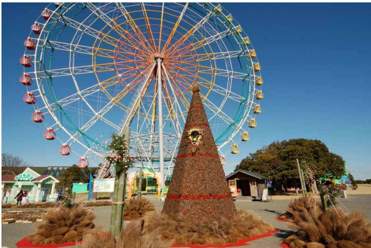
巨大松ぼっくりツリーお正月バージョン(写真は昨年度のもの)

ひたち海浜公園では、先日来よりご案内しておりました「巨大松ぼっくりツリー」と「巨大地上絵」が、 12月26日(土)より正月風に模様替えします。 ツリーに、ワラボッチや紅白の繭玉(まゆだま)を飾るほか、地上絵にも「祝2010」の文字が加わります。装いも新たに新年を迎える慶びと温かい気持ちを込めて皆様をお迎えいたしますので、是非、ご来園ください。