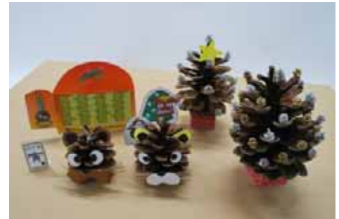
まつぼっくりなどを使ったクラフト