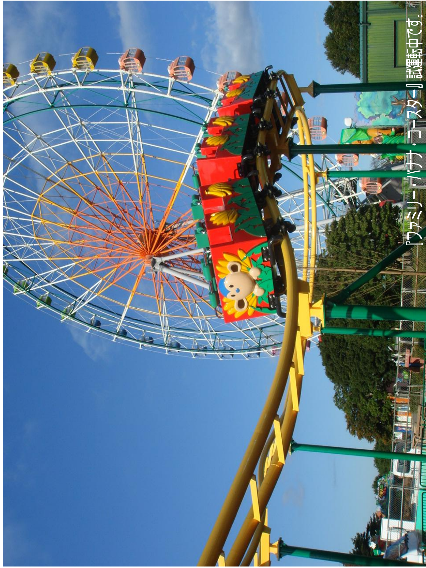
『ファミリー・バナ・コースター』試運転中です。