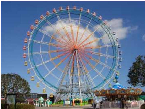
プレジャーガーデンのシンボル 大観覧車「プリンセスフラワー」

さらに、年齢65才以上の方は、園内コースターにご利用できませんでしたが『ファミリー・バナナ・コースター』は、おじいちゃんやおばあちゃんもお孫さんと一緒にお楽しみ頂ける 三世代コースター となっております。