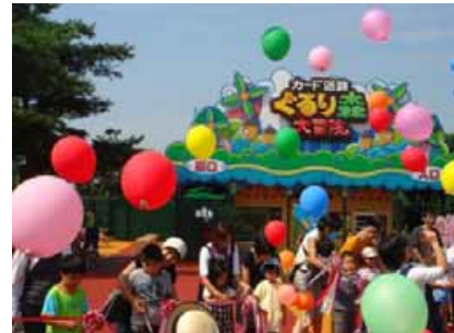
昨年オープンしたカード迷路のイベントの様子 (平成20年9月13日)