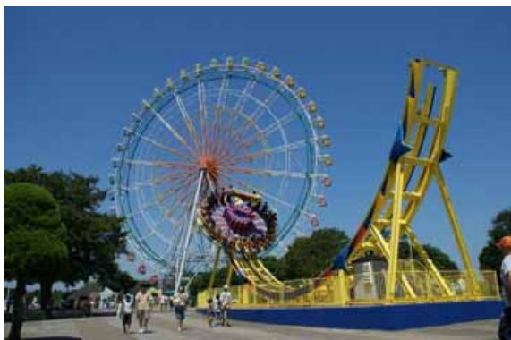
外に投げ出されるスリルとスピード！ ディスク・オー