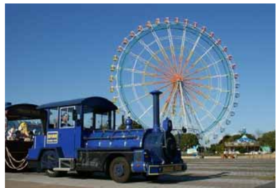
園内周遊ツアー！ シーサイドトレイン