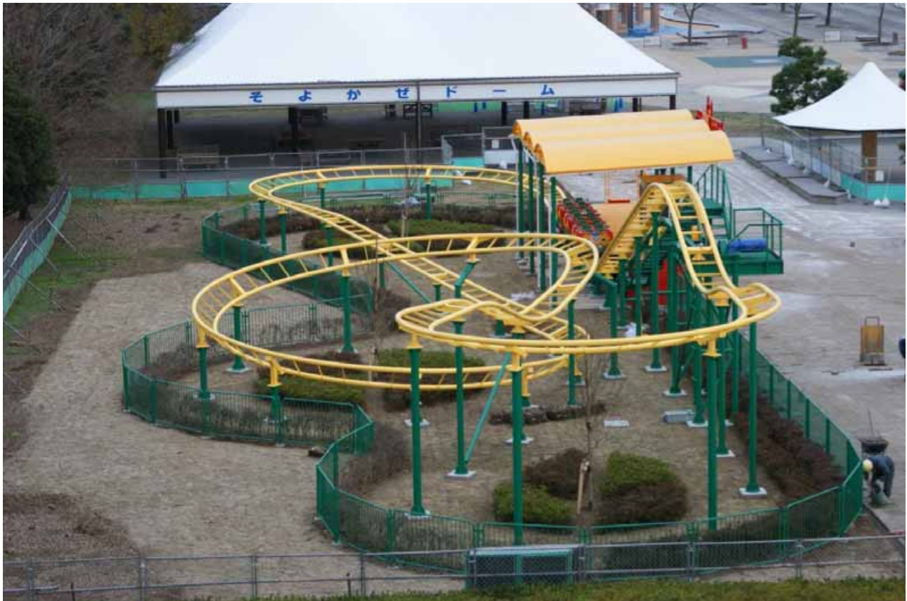
大観覧車から見た『ファミリー・バナナ・コースター』 観覧車の左下に見えます。