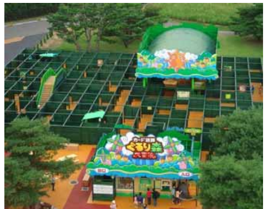
大人気！！ カード迷路「ぐるり森大冒険」