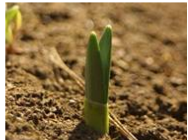
スイセンの芽 (スイセンガーデン)