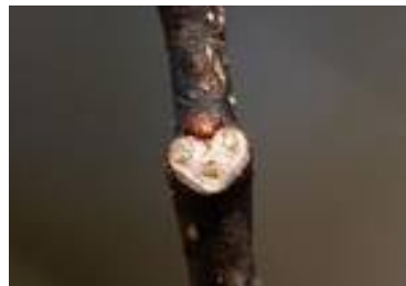
ネムノキの葉痕(ようこん) (園内各所)