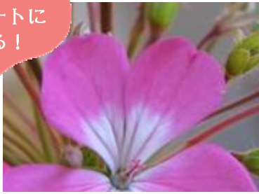
ゼラニウムの花びら (グリーン工房前)