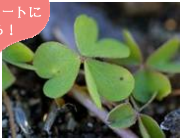
カタバミの葉 (園内各所)