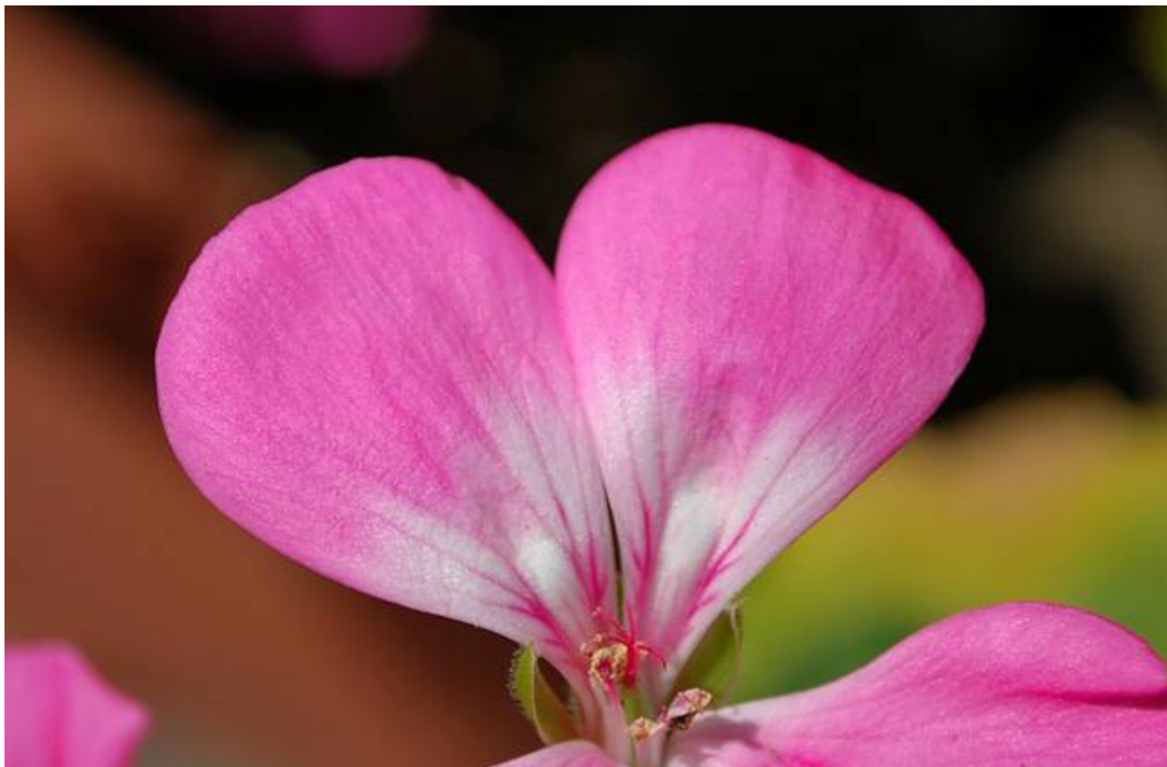
ゼラニウムの花びら(グリーン工房前)

当公園では、 2月14日(日) に“ ひたち海浜公園でハート探し ”を行います。