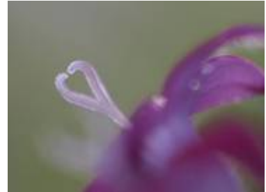
ペンタスの蕊(しべ) (公園事務所前)