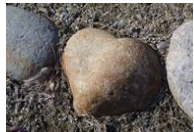
里の家前庭の石 (みはらしの里 里の家前)