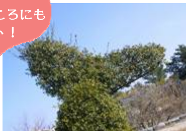
マッコウクジラのオブジェ (グリーン工房前)