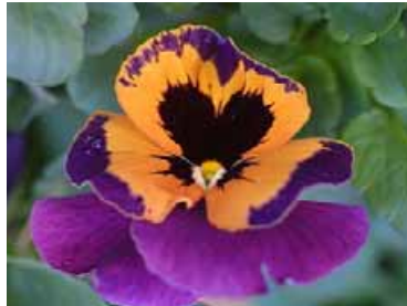
パンジーの花びら (記念の森レストハウス前 他)