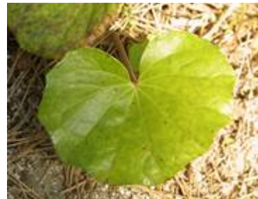
ツツブキの葉 (パーベキュー広場 他)